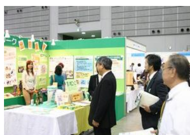
櫻井環境副大臣「エコプロダクツ東北 2007」みやぎ GPN ブース視察