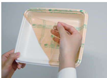
P&Pリ・リパックの構造

そんな食の話から環境活動に話題が移りました。20年近くまえに東北大学の学生さん達から教えてもらったエコ容器「P&Pリ・リパック」を使用し使い捨てプラスチックを減らす取り組みです。